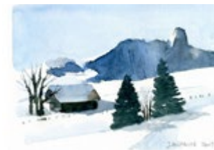
10-14 Uhr, Pavillon